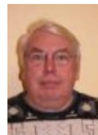
B. SMAGUE Basket Féminin