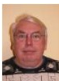
B. SMAGUE Cion Récompenses