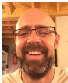
S. HERBAUT Cion Récompenses