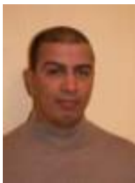
A. RACHEM Cion des arbitres