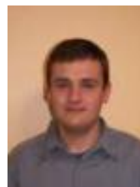
S. BAYART Cion Désignations